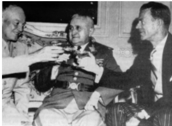
(Foto de Dutra com Eisenhower no Palácio do Catete, agosto de 1946. In: SANTOS, Joel Rufino dos. História do Brasil . São Paulo, FTD, p. 211.)

O ano de 1946 traz de volta as eleições para o cenário político brasileiro, com o fim do Estado Novo. O governo Dutra (1946 - 1951), contudo, reflete sua participação nos quadros da Guerra Fria, caracterizada pela Doutrina Truman e pelo Plano Marshall.