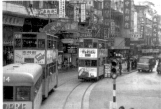
Hong-Kong, enclave britânico na China, foi devolvido em 1997.

(MOTA, Becho Myriam & BRAICK, Patrícia Ramos. História - Das cavernas ao Terceiro Milênio . São Paulo, Moderna, p. 355.)