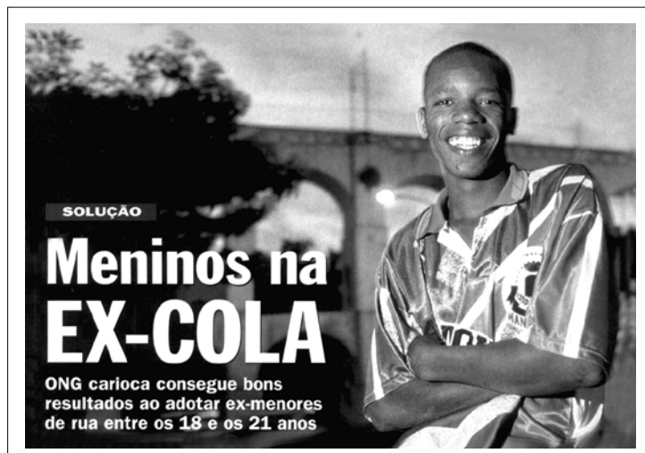
(Isto É, 08/07/99)