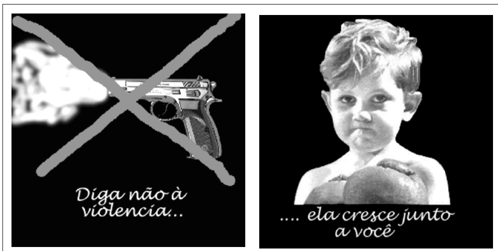
(Propaganda institucional da Casa do Caminho) http://www.cosmo.com.br/casadocaminho/