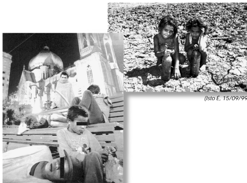
(Isto É, 15/09/99)