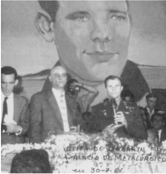
(RAMALHO, José R. & SANTANA, Marco A. (org.). Trabalho e tradição sindical no Rio de Janeiro . Rio de Janeiro: DP&A, 2001.)

“Nessas condições resta a Goulart, com apoio das organizações sindicais, dos nacionalistas e dos partidos de esquerda, passar, então, para a ofensiva e, buscando nas ruas, através de manifestações de massa e de comícios, a base que lhe faltava no Congresso. Esse ver-se-ia na contingência de recusar a realização da sua vontade, particularmente no tocante às Reformas de Base.