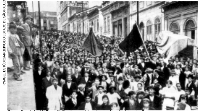
Greve Geral de 1917: multidão de operários descendo a Ladeira do Carmo.

(CAMPOS, Flavio de e MIRANDA, Renan G. Oficina de história . São Paulo: Moderna, 2000.)