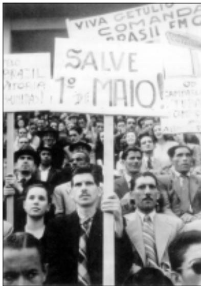
(Nossa História, maio de 2004)