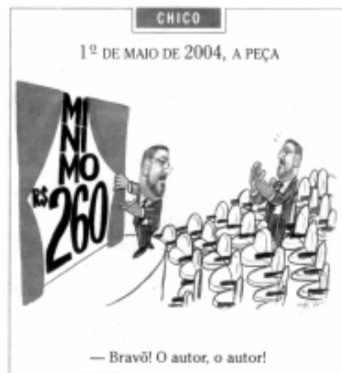
(Folha de São Paulo, 25/04/2004)

As imagens acima nos remetem a diferentes momentos históricos das celebrações do 1º de maio no Brasil. Assim como no Estado Novo e nos dias de hoje, desde o início do século passado, o trabalho tem sido alvo de atenção. No período da República Velha, a instituição responsável pela mediação da relação capital-trabalho e sua respectiva base jurídica eram: