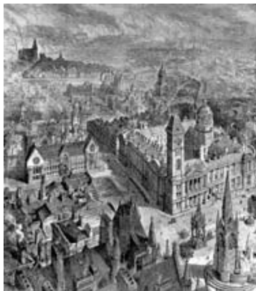
A evolução das cidades. Coleção História em Revista. Rio de Janeiro: Abril Coleções, 1996.

Coketown era uma cidade de tijolos vermelhos, ou melhor, de tijolos que seriam vermelhos se a fumaça e as cinzas permitissem, cidade de máquinas e de altas chaminés. Apresentava muitas ruas largas, todas iguais, e muitas ruazinhas ainda mais iguais, cheias de pessoas também muito iguais, pois todas saíam e entravam nas mesmas horas, andando com passo igual na mesma calçada, para fazer o mesmo trabalho, e para elas cada dia era parecido com o da véspera e com o dia seguinte.